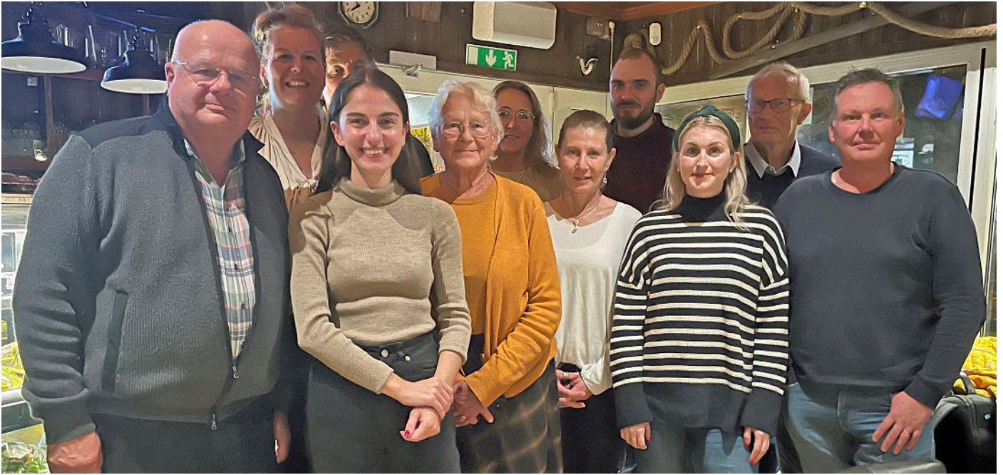
Romina Pourmokhtari på besök i Bohuslän. Här tillsammans med medlemmar från Tanum och Strömstad.